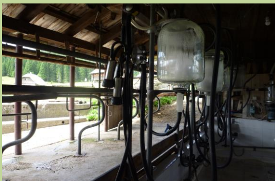
(牧場に隣接する農業施設)

登山コースは広大な原っぱから始まります。牛がのびのびと飼育されており、夏場にはしぼりたての新鮮な牛乳からつくられたヨーグルトやチーズを近くの農家で購入することもできます。