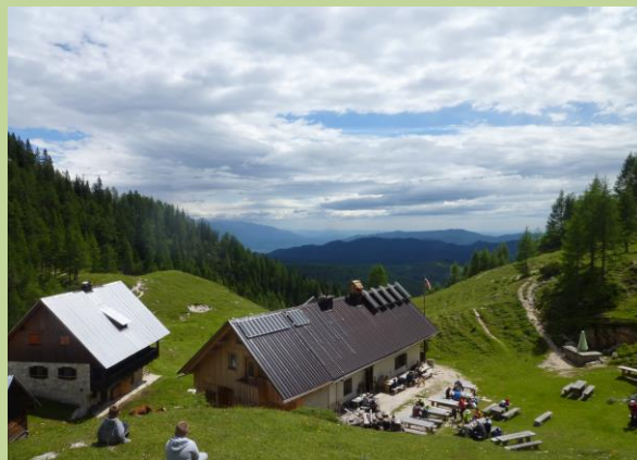
(休憩所となる山小屋)

道のりの3分の2までは比較的なだらかな道が続き、道端に咲く高山植物を長めながら木々に囲まれたコースをのんびりと進むことができます。子供からお年寄りまで幅広い方々が山歩きを楽しんでいます。本格的な登山が始まる前に中継地点として山小屋があり、スープやソーセージなど軽い食事をとることができるので是非一休みしましょう。山で食べるご飯は格別ですし、小高い丘からゆっくりと美しい景色を眺めることもできます。