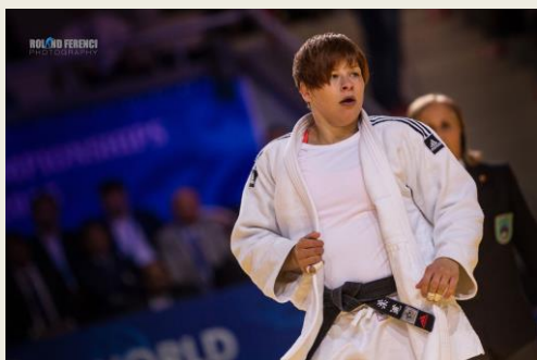
ティナ・トゥルステニャク選手